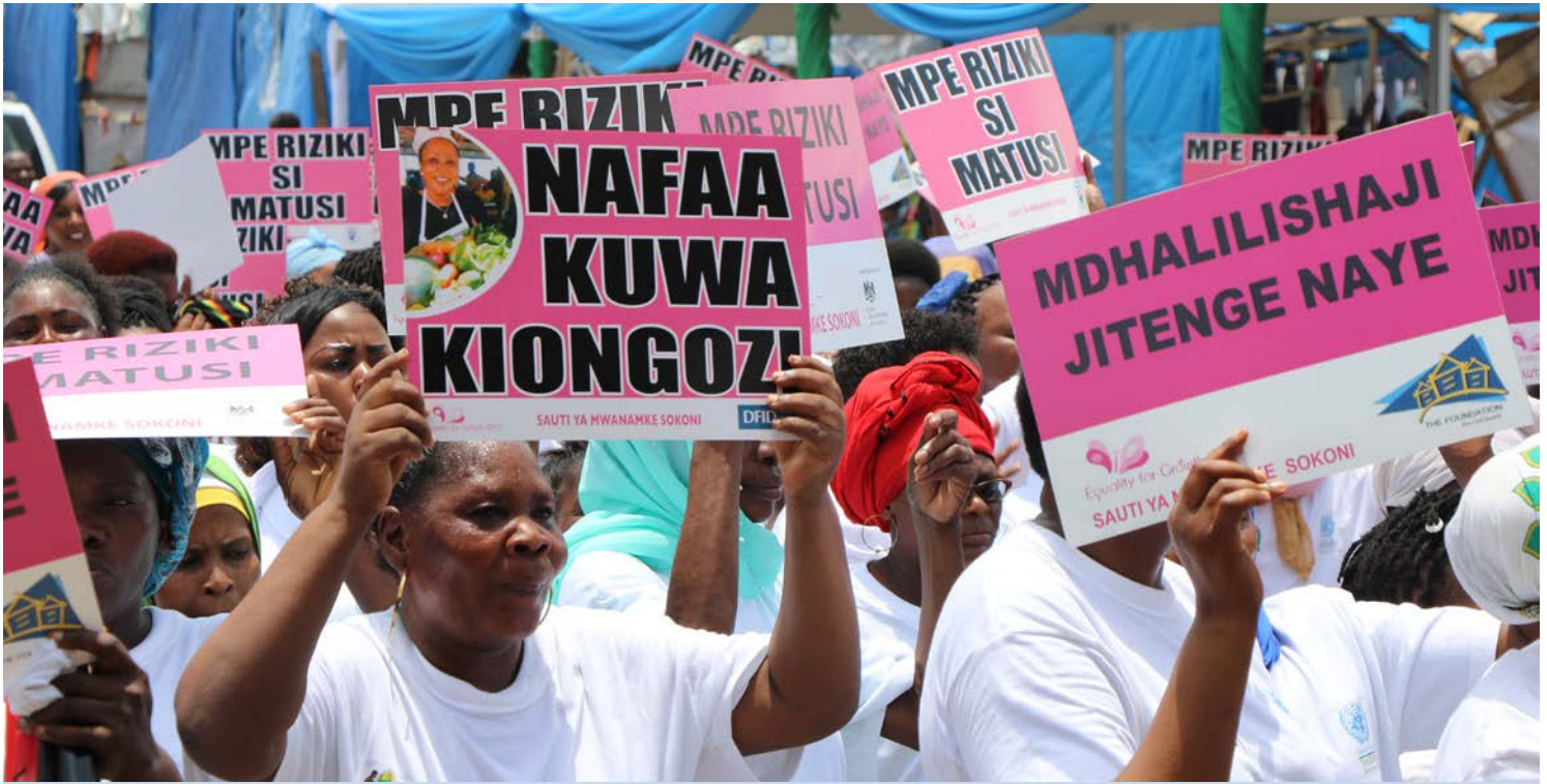
Wanawake wafanyabiashara katika Soko la Mchikichini, Ilala, Dar es Salaam, wakisherehekea Siku ya Kimataifa ya Wanawake. UN Women imekuwa ikiwasaidia wanawake wafanyabiashara katika masoko ya mitaani kote jijini Dar es Salaam tangu mwaka 2015.