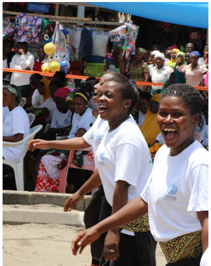
Watoa burudani wakiendelea na kazi yao katika Siku ya Kimataifa ya Wanawake katika Soko la Mchikichini, Ilala, Dar es Salaam.