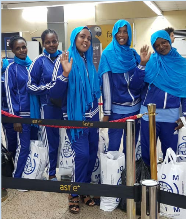
Wasichana sita raia wa Ethiopia waliokuwa wamefungwa katika magereza nchini Tanzania wakiwasili kiwanja cha ndege tayari kurejeshwa kwao. Shirika la IOM liliwasafirisha kwa usalama raia hao wa Ethiopia.

Mnamo mwezi Machi, Shirika la Umoja wa Mataifa la Wahamiaji (IOM) nchini Tanzania liliendesha mpango wa kubaini utaifa kwa wahamiaji wasio rasmi waliodaiwa kutoka Ethiopia waliokuwa wametiwa nguvuni katika magereza sita ya Tanzania, yaani, magereza ya Bukoba, Kitengule Prison, Butimba, Maweni, Kigongoni na Gereza la Keko.