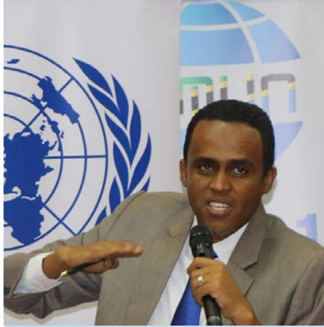
Mbunge wa Nzega Mjini, Mh. Hussein Bashe, akiwahutubia vijana wakati wa TIMUN 2018 kuhusu ubunifu na namna gani vijana wanaweza kutumia udadisi kutekeleza Malengo ya Dunia.