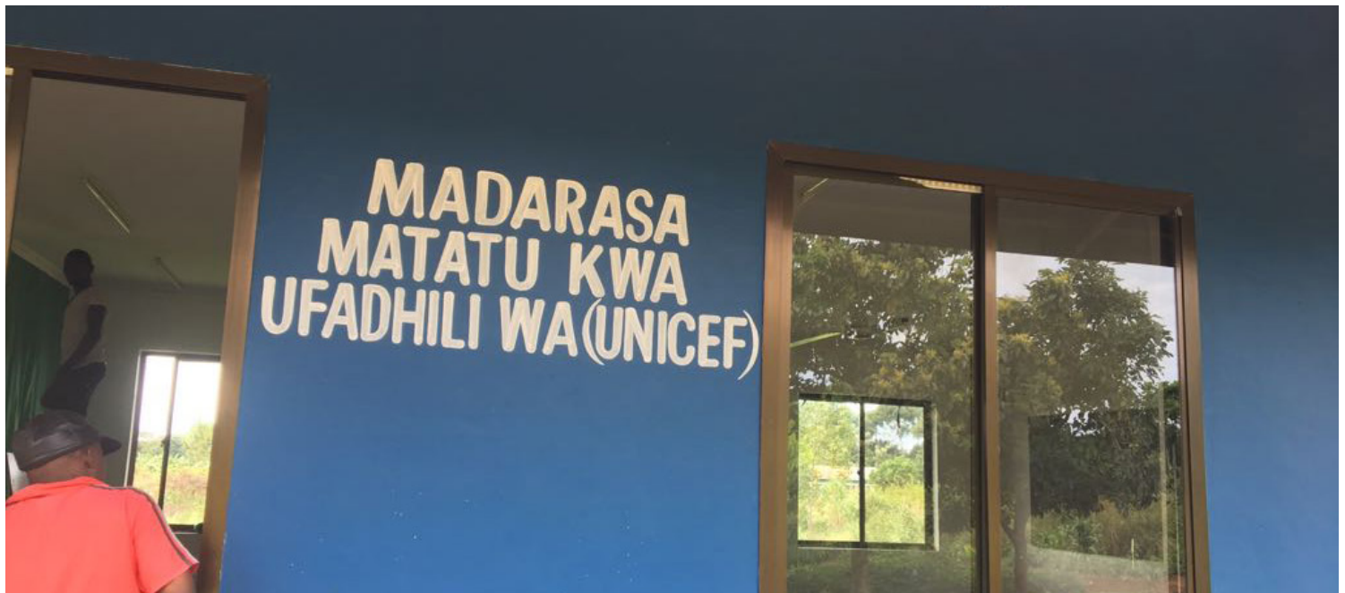
Moja ya darasa lililokarabatiwa na UNICEF baada ya tetemeko la ardhi la Septemba, 2016 mkoani Kagera.