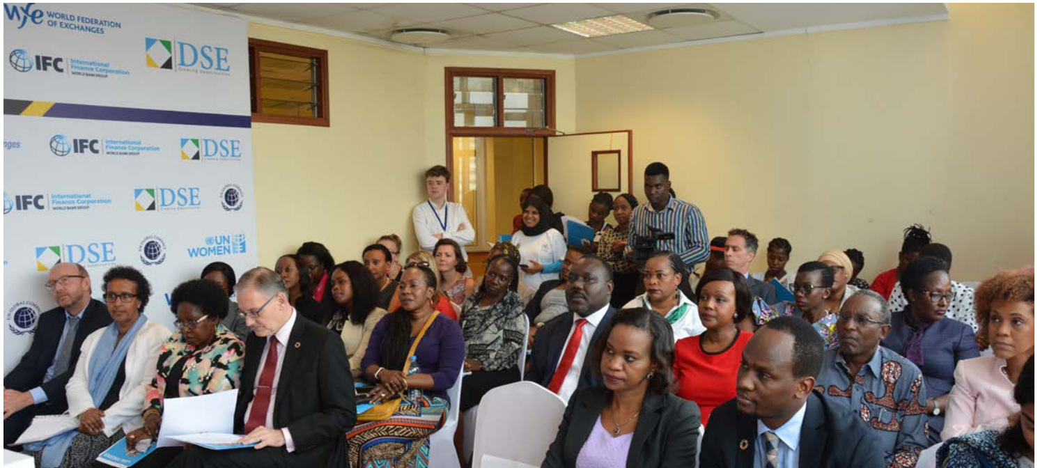
Washirika wa Maendeleo, maofisa wa serikali, maofisa wa UN, wafanya biashara na wadau wengine wakishiriki katika tukio la Kugonga Kengele ya Usawa wa Jinsia katika Soko la Mitaji la Dar es Salaam katika Siku ya Kimataifa ya Wanawake.