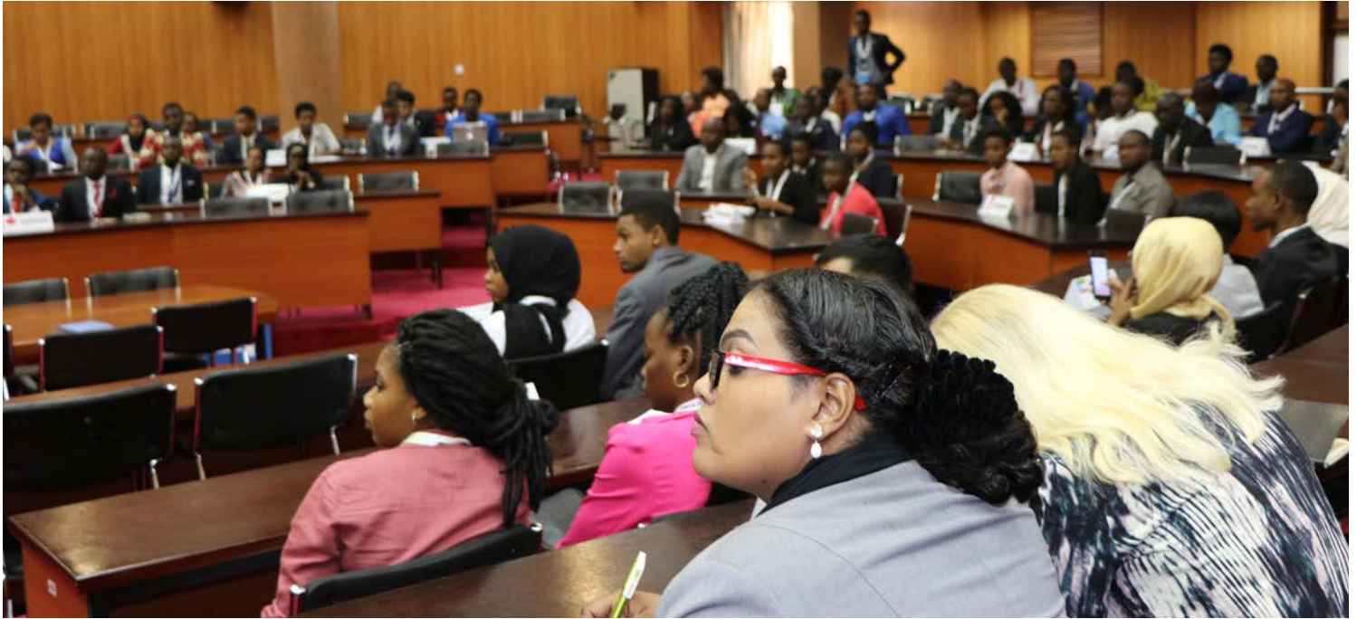
Wajumbe wa Kimataifa na wa Tanzania wakifuatilia sherehe za ufunguzi wa Tanzania International Model UN (TIMUN) 2018 zilizofanyika Dodoma.

Modeli ya Umoja wa Mataifa ya Tanzania (Tanzania International Model United Nations (TIMUN)) ni mkutano wa kila mwaka wa vijana unaowaleta zaidi ya washiriki 200 kutoka katika nchi wanachama wa Umoja wa Mataifa katika baraza kuu ili kujadiliana kuhusu mada na maudhui yaliyochaguliwa.