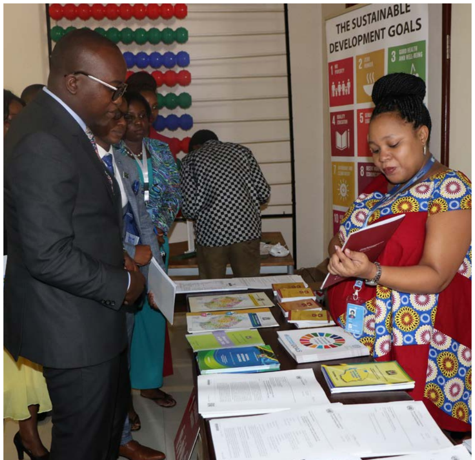
Naibu Waziri wa Nchi katika Ofisi ya Waziri Mkuu anayeshughulika na Sera, Masuala ya Bunge, Ajira, Kazi, Vijana na Walemavu (kushoto) akitembelea maonyesho ya One UN baada ya kufunguliwa kwa TIMUN 2018. Alipokelewa na Ofisi wa Ushirika na Mawasiliano kutoka Ofisi ya Mratibu Mkazi wa UN, Bi. Nafisa Didi.

TIMUN 2018 sasa iko mwaka wa pili tangu ushirika huu uanzishwe ambapo zaidi ya vijana 45,000