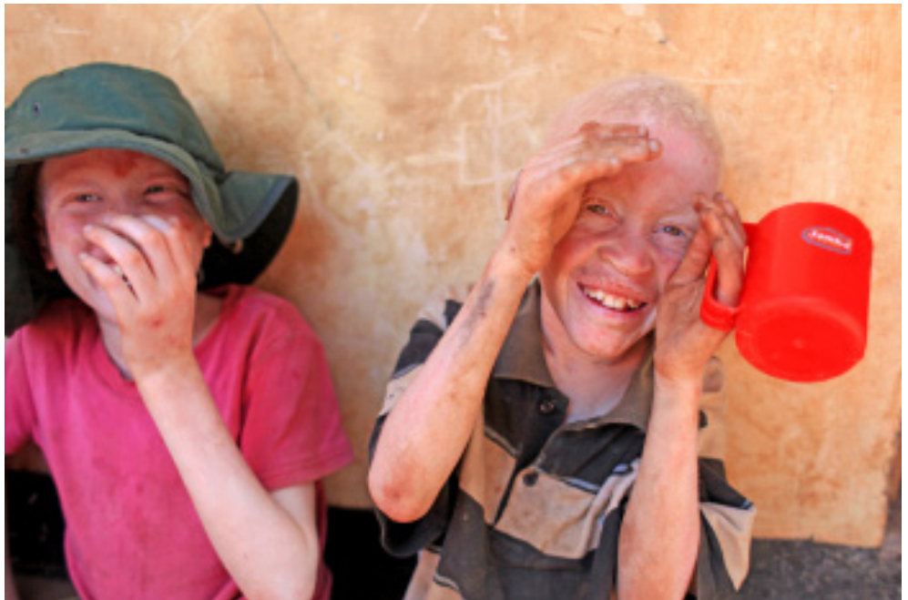
Watoto wawili wakitabasamu kwa furaha wakati wa moja ya ziara za kusaidia watoto walio hatarini.

Kufuatia tetemeko baya lililokumba Mkoa wa Kagera, UNICEF iliombwa na Waziri wa Elimu, Sayansi na Teknolojia, Prof Joyce Ndalichako, kusaidia kuikarabati shule hiyo ili watoto walioathiriwa wapate nafasi ya kuendelea na safari yao ya kujifunza. Tetemeko la ardhi liliharibu kabisa majengo 840 ambapo zaidi ya nyumba 1,200 zilipata uharibifu mkubwa na kuwafanya maelfu ya watu kukosa makazi, huku wanafunzi, wakiwemo wa Shule ya Msingi ya Mugeza Mseto ya Watoto wenye Mahitaji Maalumu, kukosa madarasa, vyoo,