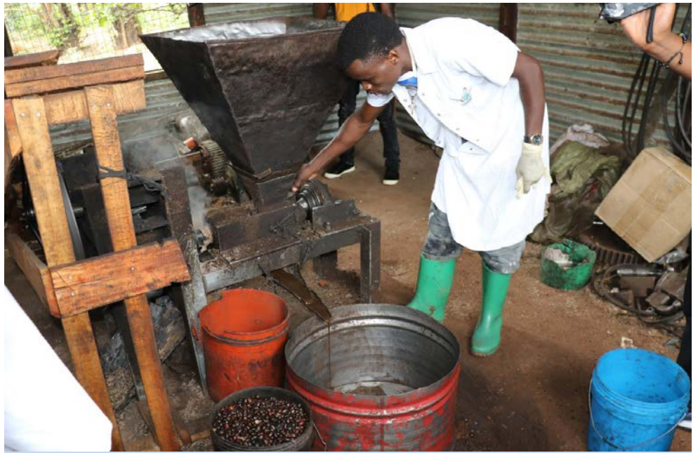
Mmoja wa watu walionufaika na programu ya pamoja ya awali ya UN katika Mji wa Kigoma akiwaonyesha wajumbe namna ya kukamua mafuta kutoka kwenye biwi la miwese.

Ziara za uwandani zilifanyika katika eneo la uzalishaji la vijana waliopewa mafunzo na Kituo cha Vijana cha Nyakitonto. Vijana hao waliopata mafunzo chini ya programu hii walionyesha baadhi ya shughuli zao za ujasiriamali kama vile uchakataji