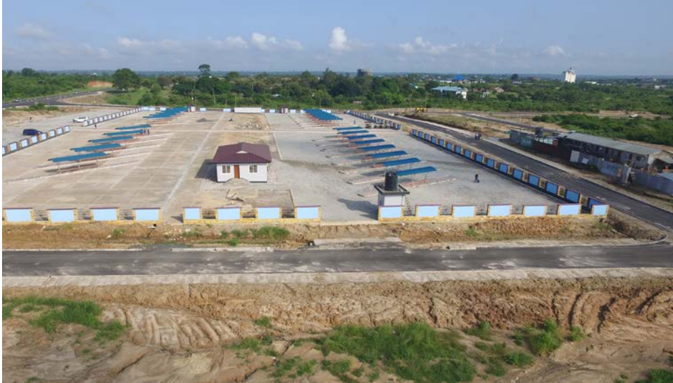
Kituo Kikuu kipya cha mabasi cha Halmashauri ya Mji wa Kibaha kikiwa katika hatua za mwisho za ujenzi.

Halmashauri ya Mji wa Kibaha (KTC) inajenga kituo kikuu cha mabasi cha kisasa chenye uwezo wa kupokea takribani mabasi 600, mabasi madogo 1,500 na hadi watu 96,000 kwa siku. Kituo hiki kikuu kipya ni suluhisho kwa kilio cha watu wa Kibaha kwa huduma hiyo kufuatia kuvunjwa kwa kile cha awali kilichokuwa Maili Moja katika mpango wa kupanua barabara kuu ya Dar es Salaam hadi Chalinze. Mwanzoni, KTC ilitumia fedha ku-