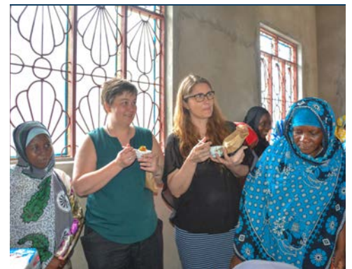
Wabunge kutoka Sweden wakionja chakula kilichotayarishwa na wanawake wajasiriamali.

Msaada huo pia unajumuisha mafunzo juu ya namna ya kutumia mashine katika mchakato wa uzalishaji. Kikundi kilianzishwa mwaka 1998 na kuwa mwanachama wa Mradi wa Klasta ya Mwanzi Zanzibar mwaka 2008. Wanachama wake wote wanajishughulisha na kilimo cha mwani na kuongeza thamani kwa kutengeneza bidhaa kama vile sabuni, mafuta ya mwili, keki na juisi.