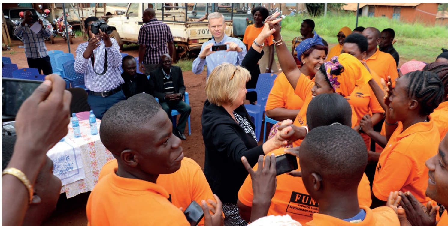
Balozi wa Norway nchini Tanzania, Mh. Elisabeth Jacobsen akipokelewa na mabingwa wa jamii wa kupambana na ukatili wa kijinsia (GBV) katika Wilaya ya Kibondo. Hawa walipewa mafunzo na mashirika ya UN. Mabingwa hawa hufundishwa kuhusu madhara ya GBV katika jamii zao na wao huwa mawakala wa kuipiga vita. Hadi leo, jumla ya wanaharakati wa jamii 200 na waelimisha rika 96 wamebainishwa na wamewafikia jumla ya watu 6,853 (wanawake 4,250 na wanaume 2,603) kupitia mijadala ya wazi ya jamii na vipindi vya video vinavyokazia kupiga vita kabisa, kukataa ukatili, na kuchukua hatua kwa pamoja, kama vile kutoa taarifa kuhusu aina yoyote ya unyanyasaji wanaofanyiwa wanawake na wasichana.