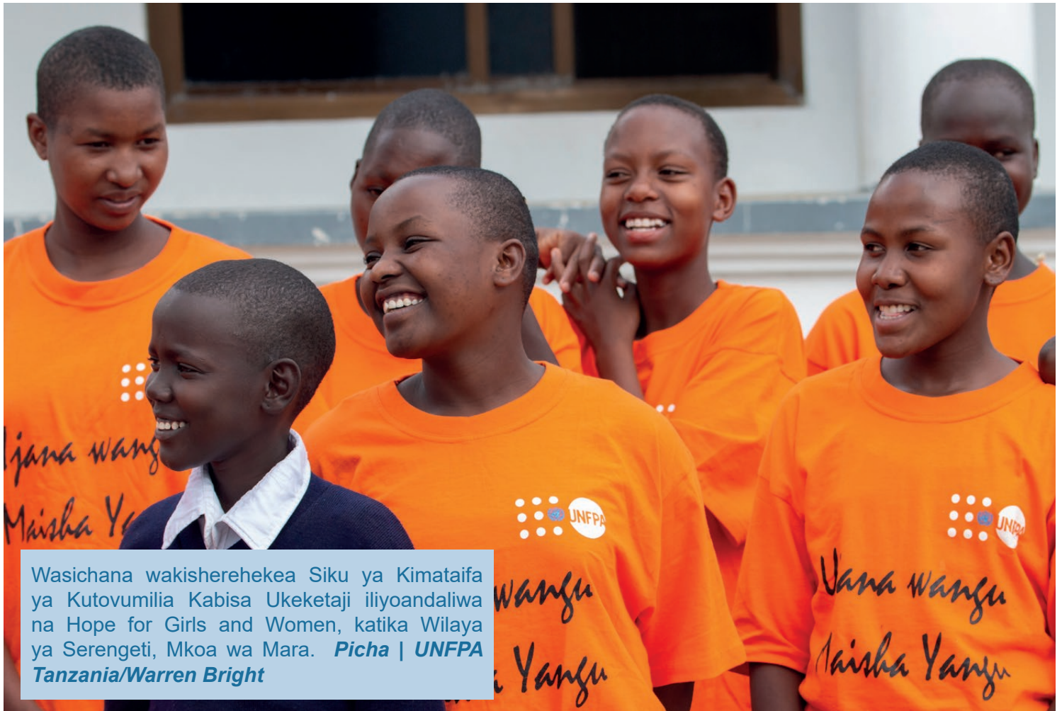
Wasichana wakisherehekea Siku ya Kimataifa ya Kutovumilia Kabisa Ukeketaji iliyoandaliwa na Hope for Girls and Women, katika Wilaya ya Serengeti, Mkoa wa Mara.

Kwa kutoa misaada kwa wizara zinazohusika na washirika wengine, UNFPA imedhamiria kuhakikisha kwamba hadi kufika mwaka 2030 hakutakuwa na msichana anayeishi kwa kuogopa kukeketwa nchini Tanzania. Viongozi wa dunia kwa kauli moja waliungana na kupitisha suala hili kama moja ya malengo ya Ajenda ya 2030 kwa malengo ya kukomesha ukeketaji. Hatua kadhaa zimepigwa nchini Tanzania na ukeketaji umepungua lakini kama nchi haina budi kuongeza juhudi ili kufikia lengo hilo.