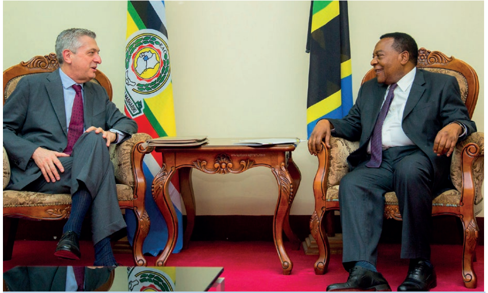
Kamishna Mkuu wa UNHCR, Bw. Filippo Grandi (kushoto) akijadiliana jambo na Waziri wa Katiba na Mambo ya Sheria, Mh. Augustine Mahiga (kulia).

katika kambi zilizo jirani na mpaka na wengi wao wameishi hapo kwa miongo kadhaa. Bw. Grandi aliisifu Tanzania kwa kuunga mkono Ushirikiano wa Kimataifa kwa ajili ya Wakimbizi, ambayo ni makubaliano yanayohimiza mshikamano zaidi miongoni mwa jamii ya kimataifa inayotoa hifadhi kwa wakimbizi.