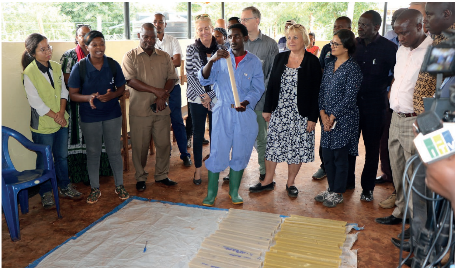
Ujumbe ulipata nafasi ya kuwasikiliza vijana ambao wameweza kupata ujuzi mbalimbali kupitia Kituo cha Maendeleo ya Jamii cha Kasanda (MPCC) kilicho nje ya Kambi ya Wakimbizi ya Mtendeli katika Wilaya ya Kakonko. Kupitia MPCC, wakazi wa eneo hilo na wakimbizi kutokana na mafunzo yanayotolewa hapo hasa kuhusu useremala, ushonaji, utengenezaji sabuni na TEHAMA.