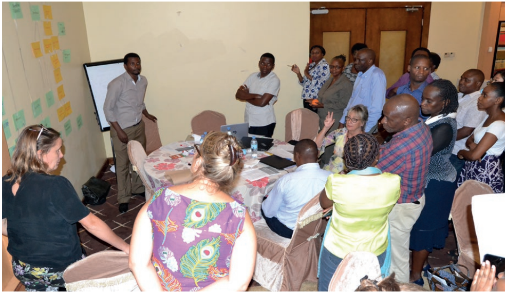
Wajumbe wa Kundi la UNDP II la Ukuaji wa Uchumi na Ukuzaji Fursa za Ajira wakishiriki mafunzo kuhusu Njia ya Kuanzisha Mifumo ya Masoko.