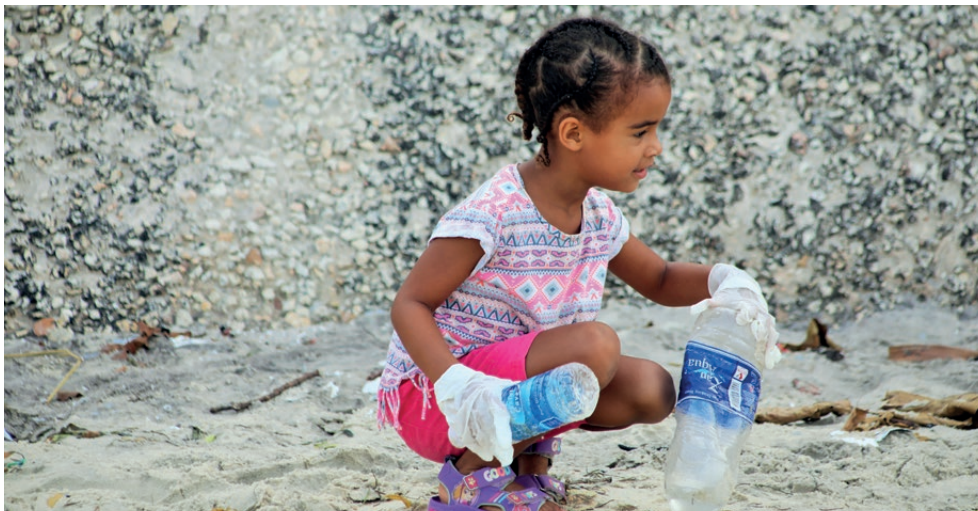
Mtoto akishiriki katika kazi ya kusafisha fukwe katika eneo la Bustani za Forodhani katika Mji Mkongwe wa Zanzibar. Serikali, Umoja wa Mataifa, makundi mbalimbali ya vijana na wadau wengine walishiriki katika kazi hiyo ya usafi.

M apema mwezi Februari, 2019, mashua Kenya na kufanya safari ya iliyotengenezwa na kihistoria ya kilometa 500 kutoka kupambwa kwa "kandambili" katika Kisiwa cha Lamu, nchini