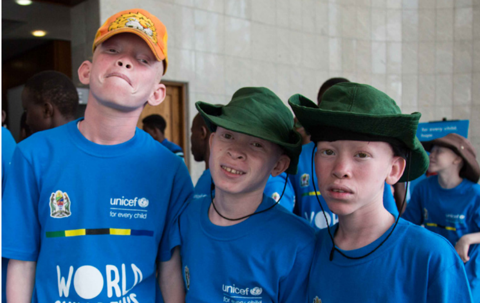
Watoto na vijana kote nchini kutumia #GoBlue kijiunga na UNICEF Tanzania katika Mazungumza Motomoto katika Siku ya Watoto Duniani. Vijana, watoto na #ChangeMakers walishiriki kikamilifu kuwatia moyo vijana wa Tanzania kutimiza ndoto na matamano yao.

“Kizazi kijacho kitakuwa ni kizazi cha vipaji na wagunduzi katika dunia inayobadilika kwa kasi sana. Wanachokihitaji ni fursa – ya kusikilizwa na kuungwa mkono katika kufanya uchaguzi sahihi ili wakue wakiwa na matumaini na maisha yenye umotomoto, malengo na huruma,” alieleza Bi. Zaman.