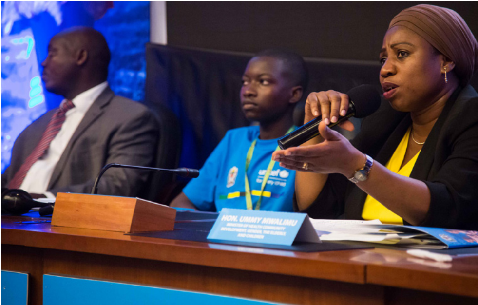
Waziri Ummy Mwalimu alikuwa mgeni rasmi katika Mazungumzo Motomoto (Activate Talk) na alirudia ahadi ya serikali ya kukomesha vitendo vya ukatili dhidi ya watoto nchini.

Vijana wapaza sauti zao katika maadhimisho ya Siku ya Watoto jijini Dar es Salaam. Mwishoni mwa mwezi Novemba, UNICEF Tanzania, kwa kushirikiana na Wizara ya Afya, Maendeleo ya Jamii, Jinsia, Wazee na Watoto iliandaa Mazungumzo Motomoto (Activate Talk) na watoto na vijana kuhusu ujumbe wa “Ndoto Zangu, Njia Yangu ...” ili kuadhimisha Siku ya Watoto Duniani.