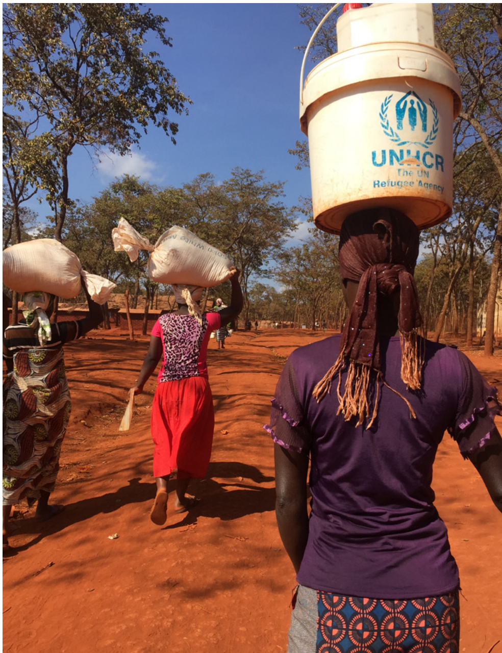
Wanachama wa vikundi vya akiba vinavyosaidiwa na UNCDF wakiua bidhaa zao katika Soko la Pamoja la Nyarugusu.

Licha ya kukabiliwa na vikwazo kadhaa, Ekyoci ni mfano mzuri wa jinsi vikundi vya kujiwekea akiba vinavyomjengea mtu tabia ya kuweka akiba, kujenga kujiamini,