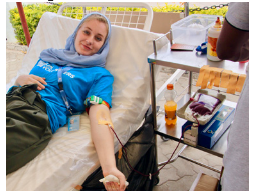
Wanachama wa Chama cha Kujitolea cha UN wakijitolea damu na kushiriki katika huduma mbalimbali za afya katika Viwanja vya Mapinduzi huko Zanzibar wakati wa maadhimisho ya Siku ya Kimataifa ya Kujitolea.