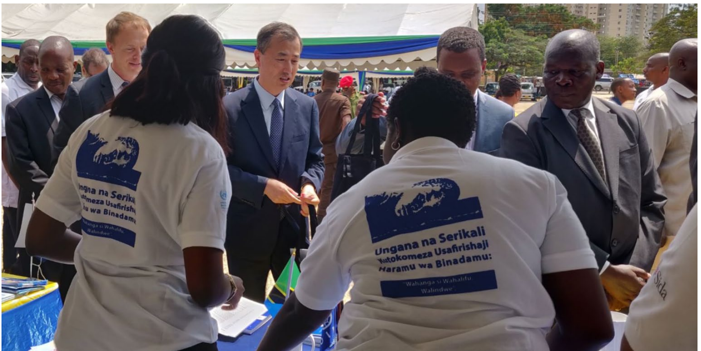
Maofisa wa ubalozi kutoka Burundi, Ethiopia, Korea Kusini, na Norway wakitembelea banda la Shirika la Umoja wa Mataifa la Uhamiaji (IOM) wakati wa Maadhimisho ya Siku ya Kupinga Biashara Haramu ya Usafirishaji Binadamu.

IOM ilitambua msaada inaoupata kutoka katika serikali za Ufalme wa Sweden, kupitia Shirika la Maendeleo ya Kimataifa la Sweden (SIDA), na Serikali ya Norway, kwani misaada hiyo ina mchango mkubwa katika kukabiliana na biashara haramu ya usafirishaji binadamu nchini Tanzania.