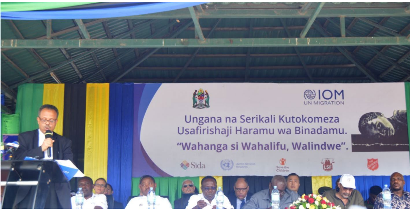
Mkuu wa IOM akizungumza na washiriki wakati wa Maadhimisho ya Siku ya Kupinga Biashara Haramu ya Usafirishaji Binadamu.

S hirika la Umoja wa Mataifa la Wahamiaji (IOM) kwa kushirikiana na Wizara ya Mambo ya Ndani wameadhimisha Siku ya Kimataifa ya Kupinga Usafirishaji Binadamu mwishoni mwa mwezi Julai katika Viwanja vya Mnazi Mmoja, Dar es Salaam. Tukio hilo lilitanguliwana Mjadala wa Kitaifa uliofanyika siku moja kabla.