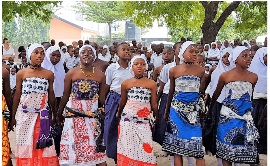
Wageni, wanafunzi wa Shule ya Msingi Mchikichini, walimu na vijana wakifuatilia wakati Klabu ya Mazingira ya Shule ya Msingi Mchikichini walipotumbuzi katika maadhimisho ya Siku ya Kimataifa ya Nelson Mandela.

Maadhimisho hayo pia yaliendana na Malengo ya Maendeleo Endelevu (SDGs) na pia Mkakati mpya wa Serikali ya Afrika ya Kusini wa kuchukua hatua madhubuti zaidi katika kuleta ufumbuzi ili kweli kupata matokeo endelevu. Katika mkakati huu mpya katika Siku ya Nelson Mandela, maeneo muhimu yaliyobainishwa ili kupewa kipaumbele katika ushiriki-