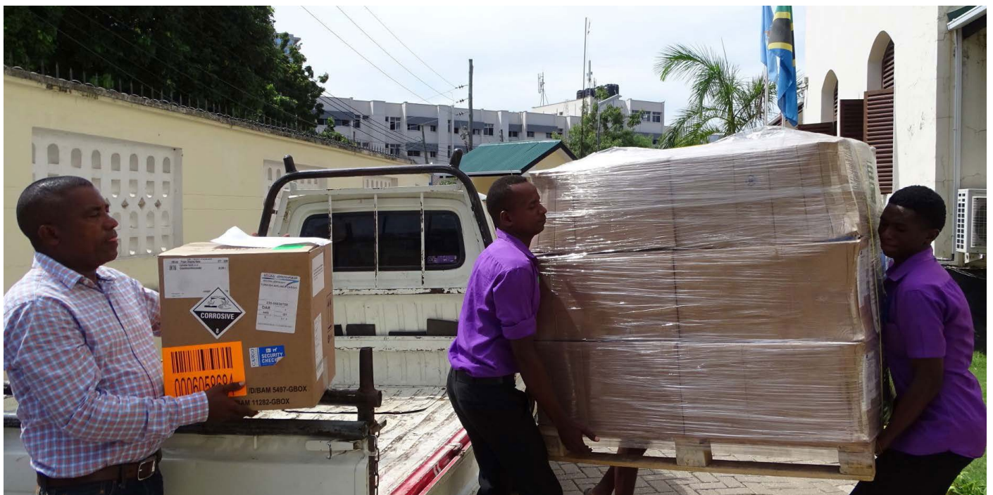
Vibarua na wafanyakazi wa WHO wakipakua makasha yenye misaada ya dawa na vifaa tiba vilivyoununuliwa na kutolewa kwa Serikali jijini Dar es Salaam.