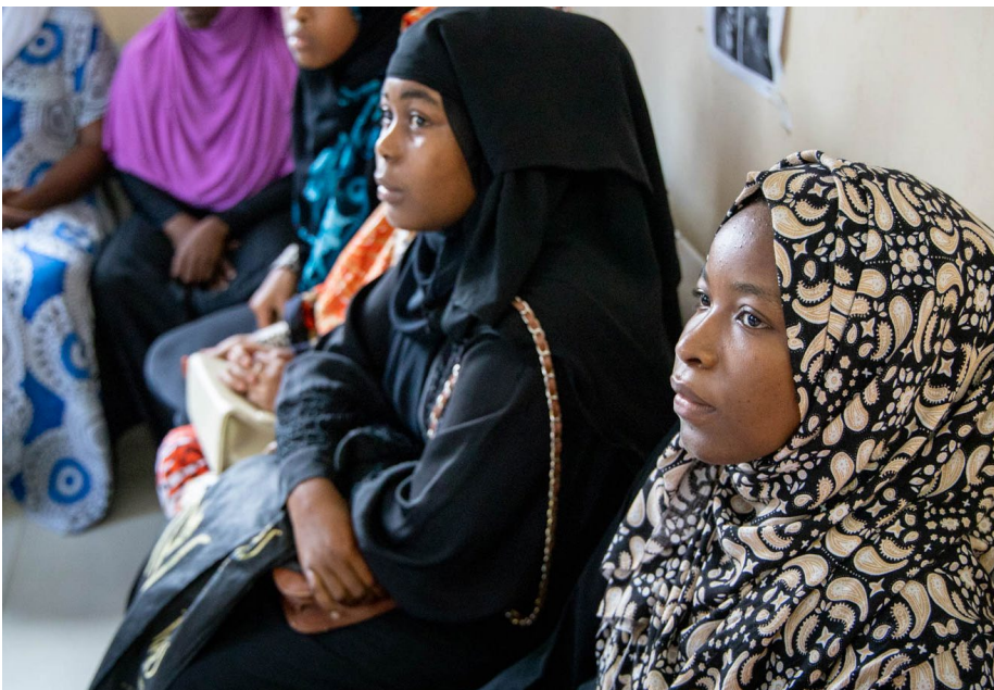
Mgogoro wa COVID-19, na hatua zinazofuatia za kujikinga vina uwezekano wa kukwamisha maendeleo ya juhudi za kutokomeza Ukeketaji (Tohara ya Wanawake) nchini Tanzania.

A faafa* (miaka 19) alipata hedhi yake ya kwanza takribani miaka sita iliyopita. Anakumbuka mama yake alivyomchukua kutoka nyumbani kwao huko Mwembe Njugu (karibu na Mji Mkongwe Zanzibar) hadi