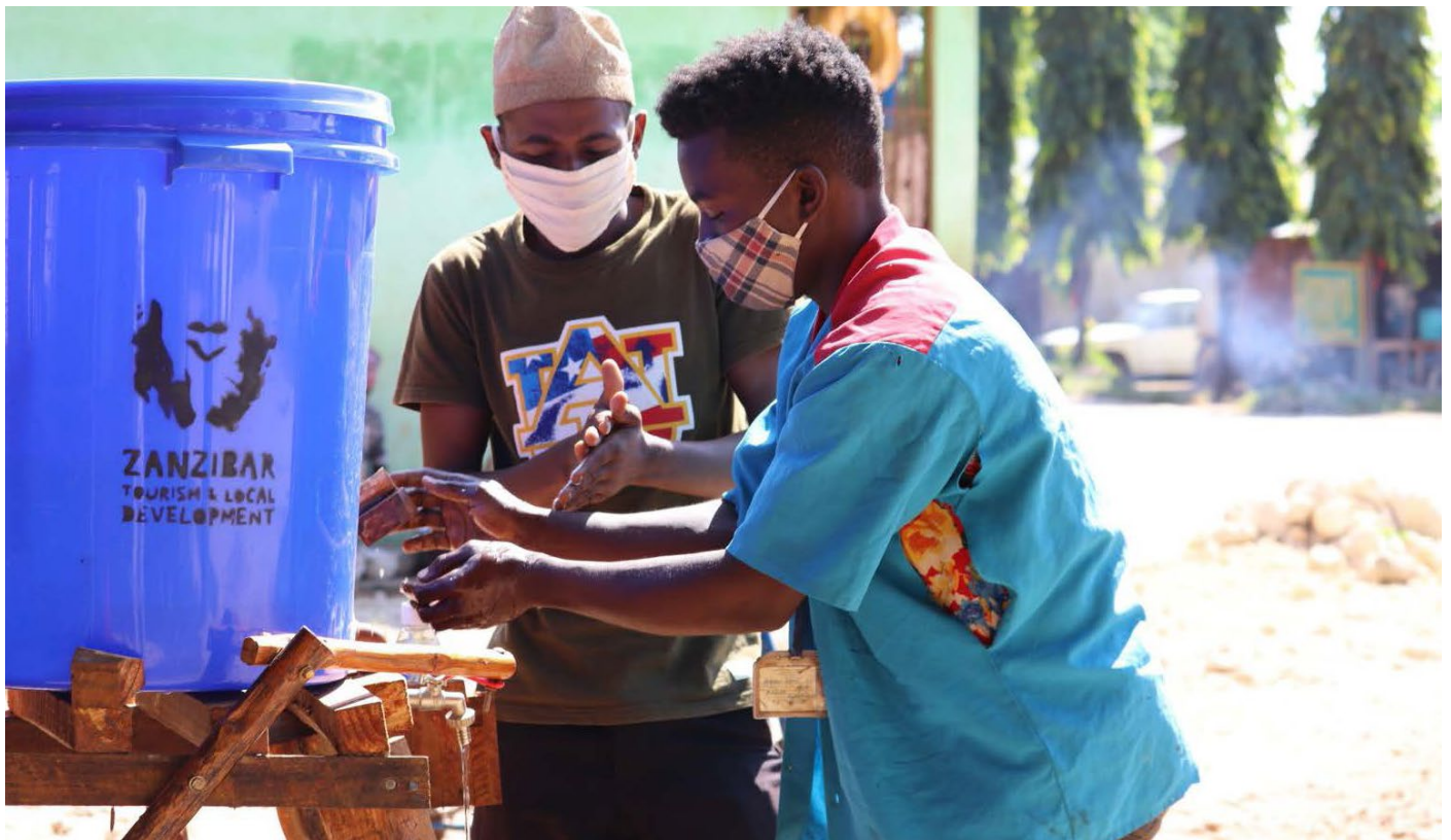
Wakati janga la COVID-19 lilipokuwa likitikisa sana, wanajamii walizingatia tabia za kijikinga, zikiwemo kunawa mikono kutumia maji yanayotiririka kutumia vifaa vilivyowekwa katika maeneo ya biashara na ya umma, kama hiki kilichokutwa katika Kituo cha Mabasi ya Mjini cha Makunduchi huko Zanzibar.