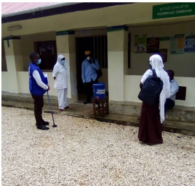
Timu ya tathmini katika Kituo cha Afya cha Kizimkazi Dimbani.