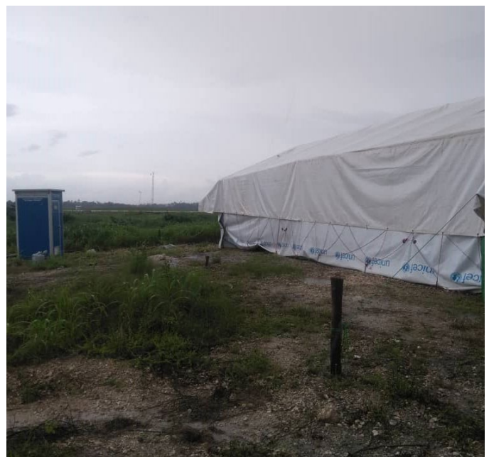
Hema kwa ajili ya wahisiwa wa ugonjwa wa COVID-19 katika kituo cha mpakani (PoE) kilichopo katika Kiwanja cha Ndege cha Pemba.