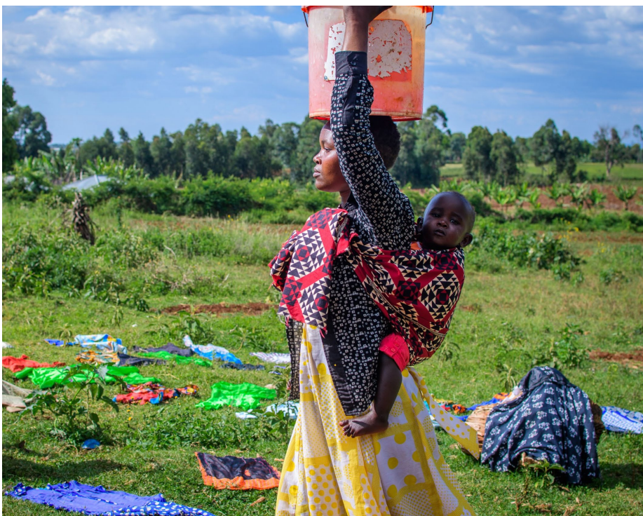
Wasichana wa umri wa balehe wakitembelea kituo rafiki kwa vijana kabla ya kuibuka kwa janga la COVID-19 nchini Tanzania.

K wa msaada wa Shirika la Umoja wa Mataifa la Idadi ya Watu (UNFPA), asasi isiyo ya kiserikali ya 'Matumani kwa Wasichana na Wanawake' ya nchini Tanzania inaendesha nyumba salama mbili katika wilaya za Serengeti na Butiama mkoani Mara kwa ajili ya wasichana waliokimbia kufanyiwa tohara makwao. Pamojanakwambautamaduni huo umeharamishwa nchini Tanzania tangu mwaka 1998 na ahadi ya serikali ya kutimiza na kufikia lengo la dunia la kukomesha kabisa vitendo vya ukatili kwa msingi wa