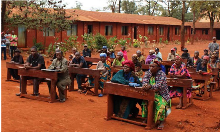
Washiriki wa majadiliano katika Kambi ya Wakimbizi ya Nyarugusu.