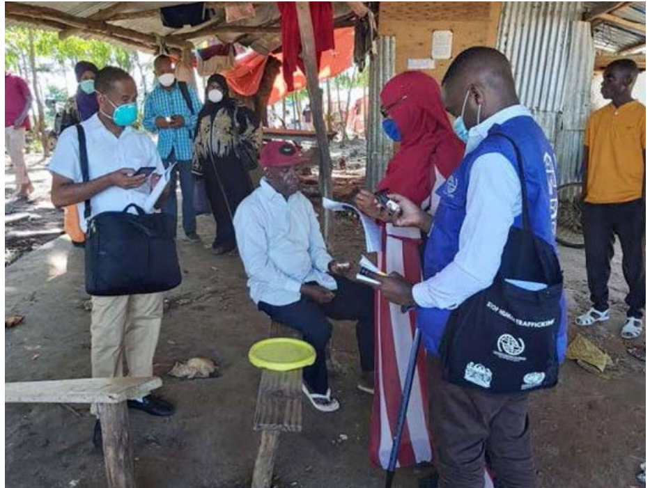
Tathmini ya Kituo cha Mpakani (PoE) kisicho rasmi ikiendelea katika Soko la Samaki la Ngalawa Bububu Kihinani, Unguja.

“Tunawashukuru sana IOM kwa msaada wa vifaa vya kunawia mikono katika POE yetu. Kituo chetu cha Mpakani kina