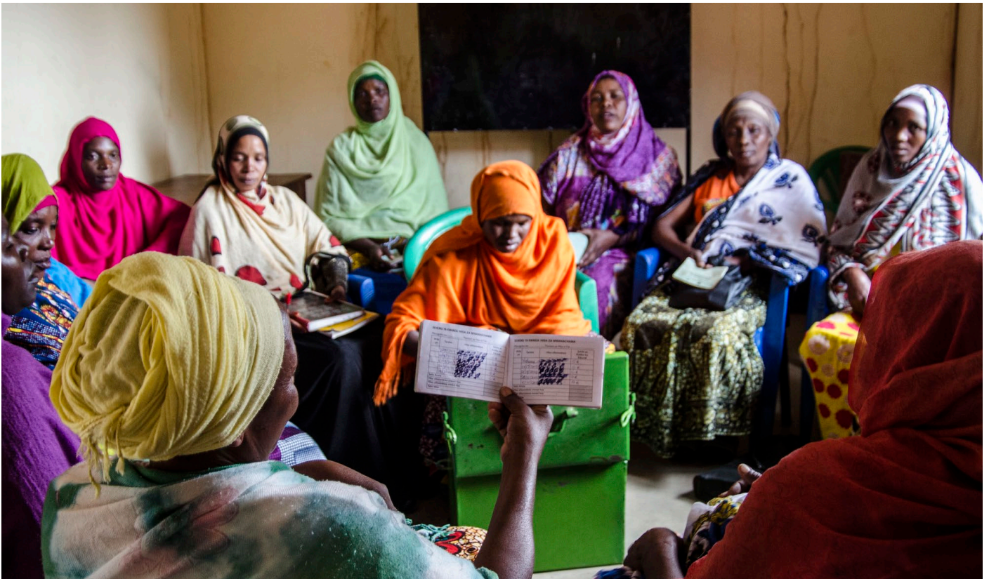
Benki ya Jamii za Vijijini (VICOBA) katika Kijiji cha Nduu inayosaidiwa na Programu ya Boresha Lishe.

S erikali ya Japani imetoa mchango wa Dola za Marekani milioni 1.5 kwa Shirika la Umoja wa Mataifa la Mpango wa Chakula Duniani (WFP) ili kusaidia uekelezaji wa mradi wa miaka minne (2017-2021) wa Boresha Lishe katika vijiji kwenye Kanda ya Kati nchini Tanzania.