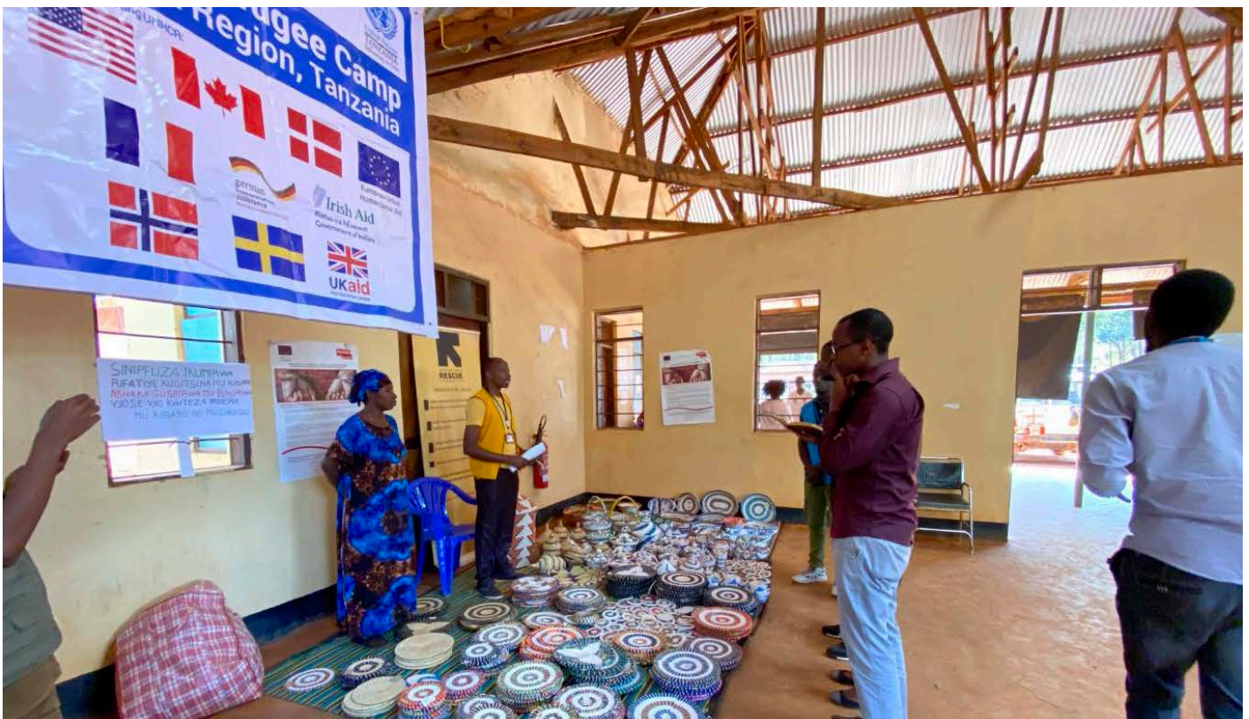
Maonyesho ya njia za kujipatia riziki yaliyofanywa na wanawake kupitia mradi wa Kikapu Ili Kuleta Ufumbuzi (Basket for Solution) katika maadhimisho ya mwaka huu ya Siku ya Wakimbizi Duniani (#WorldRefugeeDay) yaliyofanyika katika Kambi ya Wakimbizi ya Nduta.

Ukiachia mbali maadhimisho ya siku hii, Umoja wa Mataifa na washirika wanaendelea kuomba kila mmoja kutoa msaada ili kuendeleza juhudi za dunia za mshikamano na utekelezaji. Kila mmoja anaweza kuleta tofauti, na mchango wa kila mmoja una maana katika juhudi za kujenga dunia iliyo na haki zaidi, iliyo jumuishi zaidi na yenye usawa.