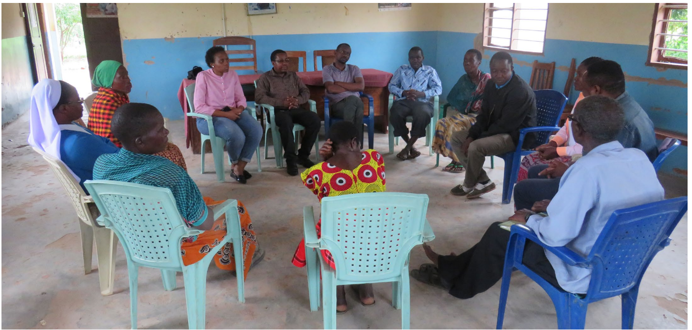
Mkutano wa majadiliano unaohusisha ILO, AZAKI na wanajamii wakiwa Ndevelwe, Tabora.

D unia imepiga hatua kubwa katika kumaliza ajira mbaya za watoto. Katika miongo miwili iliyopita, takribani watoto milioni 94 wameondolewa kwenye ajira ngumu. Furaha ya juhudi hizi kubwa zilipunguzwa kasi na janga la COVID-19. Kuna changamoto mpya zinazojitokeza hususan kufuatia kupunguzwa na kufungwa kwa shughuli za kiuchumi na kijamii (lockdowns) jambo linalotishia kuongezeka tena kwa ajira mbaya za watoto, unyanyasaji wa watoto na wanafunzi kukatisha masomo yao pale shule zitakapofunguliwa. Ujumbe wa dunia kwa Siku ya Kimataifa ya Kupinga Ajira Mbaya za Watoto kwa Mwaka 2020 (WDAFL), inayoadhimishwa kila tarehe 12