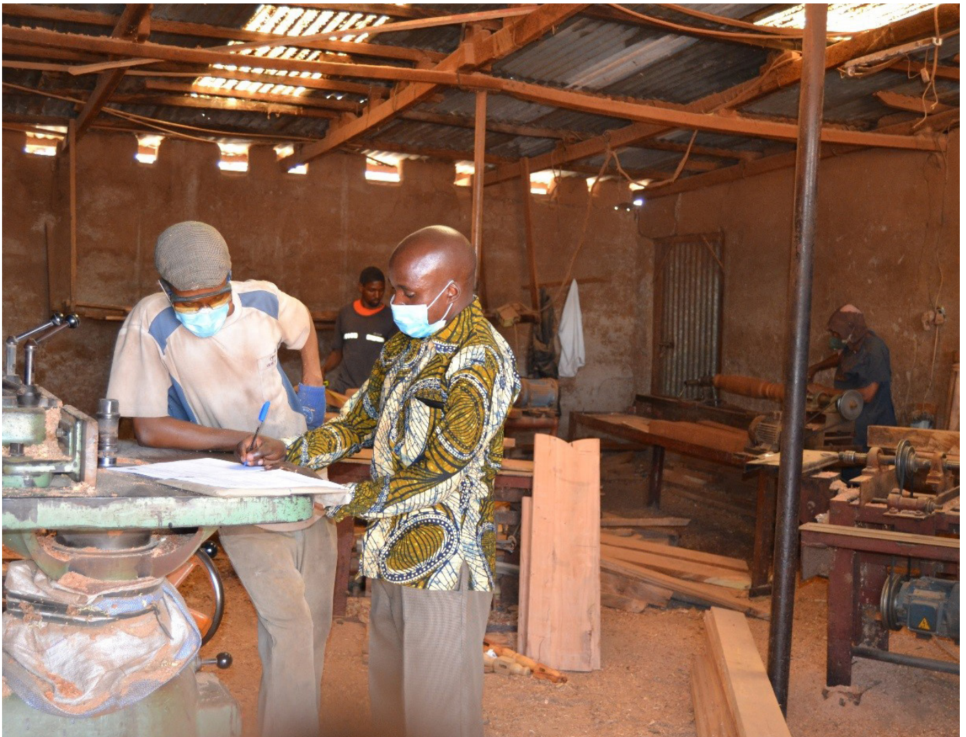
Kipindi cha mafunzo kuhusu programu ya Utambuzi wa Mafunzo ya Awali (Recognition of Prior learning (RPL)) kilichotolewa jijini Dar es Salaam hivi karibuni.

Wadau walioshiriki walibaini maeneo mengine muhimu yanayohitaji kufanyiwa kazi yakiwemo uunganishwaji wa Teknolojia ya Habari na Mawasiliano (TEHAMA) katika sekta zote na pia ili kuleta picha halisi ya matarajio ya ujuzi.