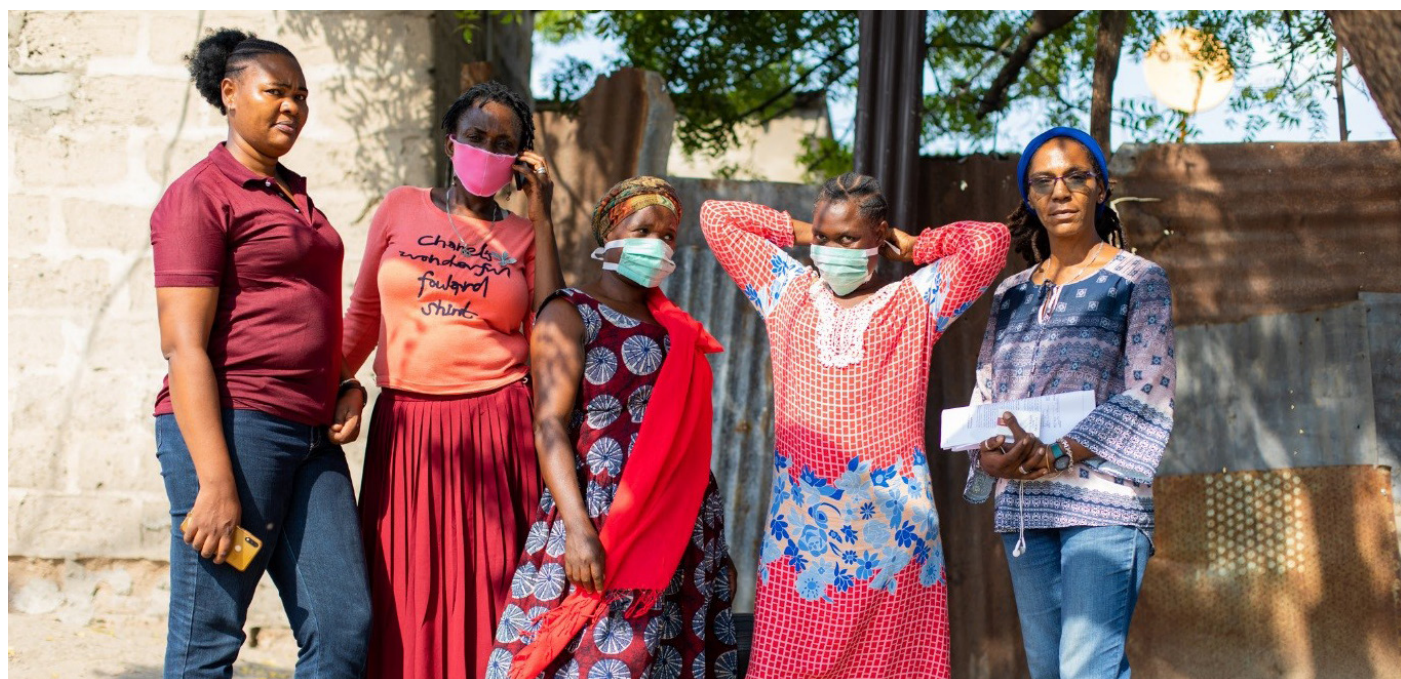
Kikundi cha akina mama na mratibu kutoka katika Mtandao wa Watu Wanaotumia Dawa za Kulevya Tanzania (TaNPUD).