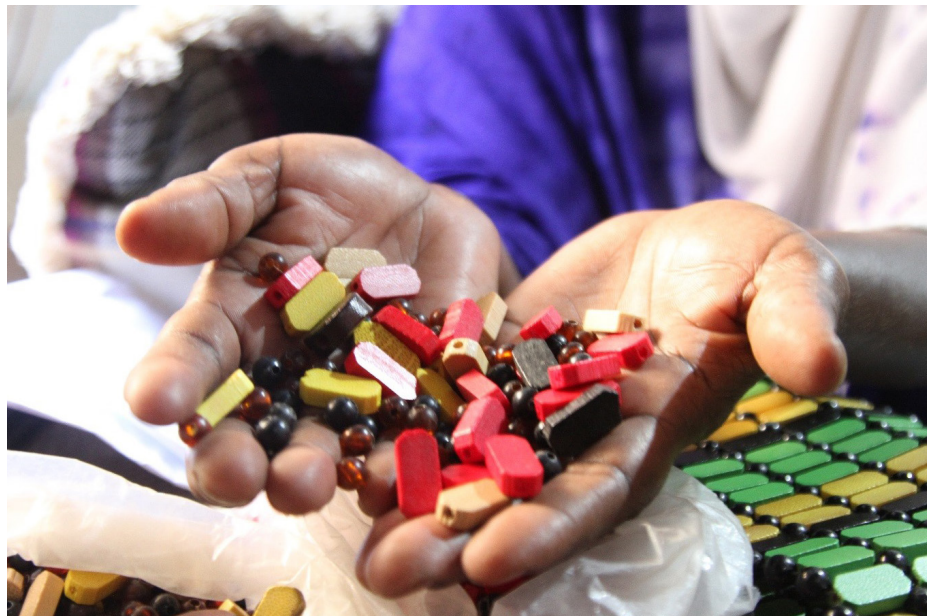
Shanga anazotumia Mukhti kupamba mikoba.

Ingawa Mukhti amekuwa mkimbizi kwa takribani thelu-