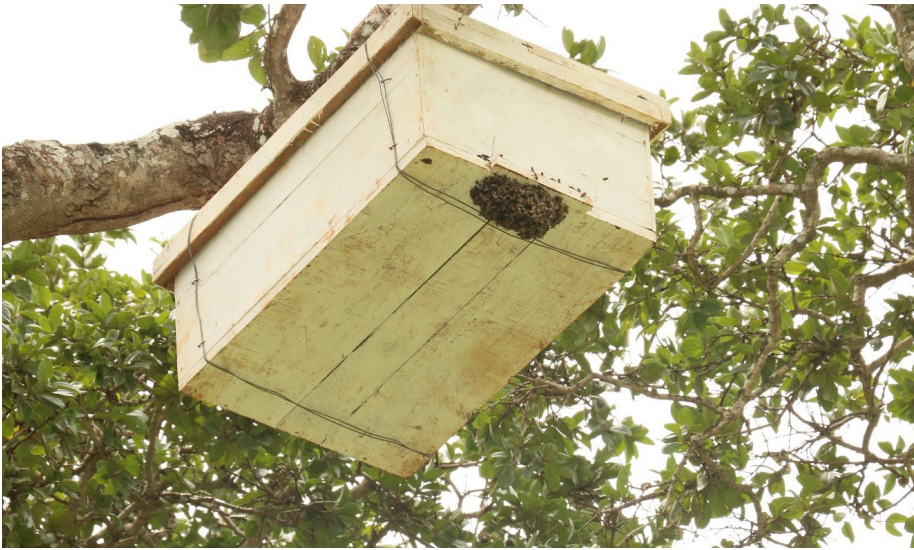
Mzinga bora wa kisasa uliotengenezwa uli katika kiwanja cha Bw. Hija ukiwa tayari kupokea nyuki.

K amasehemuya utekelezaji kwa Programu ya Pamoja ya Kigoma (KJP), Shirika la Umoja wa Mataifa la Chakula na Kilimo (FAO) hivi karibni lilitoa mafunzo kwa mafundi seremala kuhusu ‘kilimo bora cha nyuki na utengenezaji mizinga ya kisasa’. Mafunzo hayo yalilenga kuwajengea wakulima uwezo bora zaidi kuhusu namna ya kuunganisha ufugaji nyuki na Kilimo Kinachozingatia Tabianchi na Usimamizi/ Utunzaji wa Rasilimali za Asili.