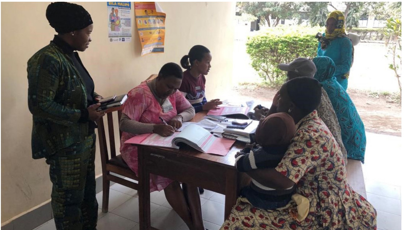
Mfumo wa usajili vizazi uliorahisishwa unafanya usajili wa vizazi kupatikana kwa jamii kwa urahisi. Wakati hapo kabla ilimpasa mzazi kusafiri hadi makao makuu ya wilaya katika kila mkoa, na si katika maeneo ya usajili kama hiki kilichopo katika Wilaya ya Hai, Mkoa wa Kilimanjaro, ambacho kimeanzishwa katika kituo cha afya.

Mfumo mpya wa usajili wa vizazi umeondoa tofauti iliyokuwepo kati ya maeneo ya vijijini na ya miji, kuongeza ufikiwaji wa jamii zilizo pembezoni kabisa ili zisajili watoto wao, na inaendelea kukabili vikwazo vinavyohusishwa na masuala ya jinsia katika usajili wa vizazi. Mfumo huu unatatua changamoto ya msingi ya 'upatikanaji' na 'unafuu wa gharama', ambavyo vyote vilikuwa vikwazo vikuu katika mfumo wa usajili vizazi nchini Tanzania.