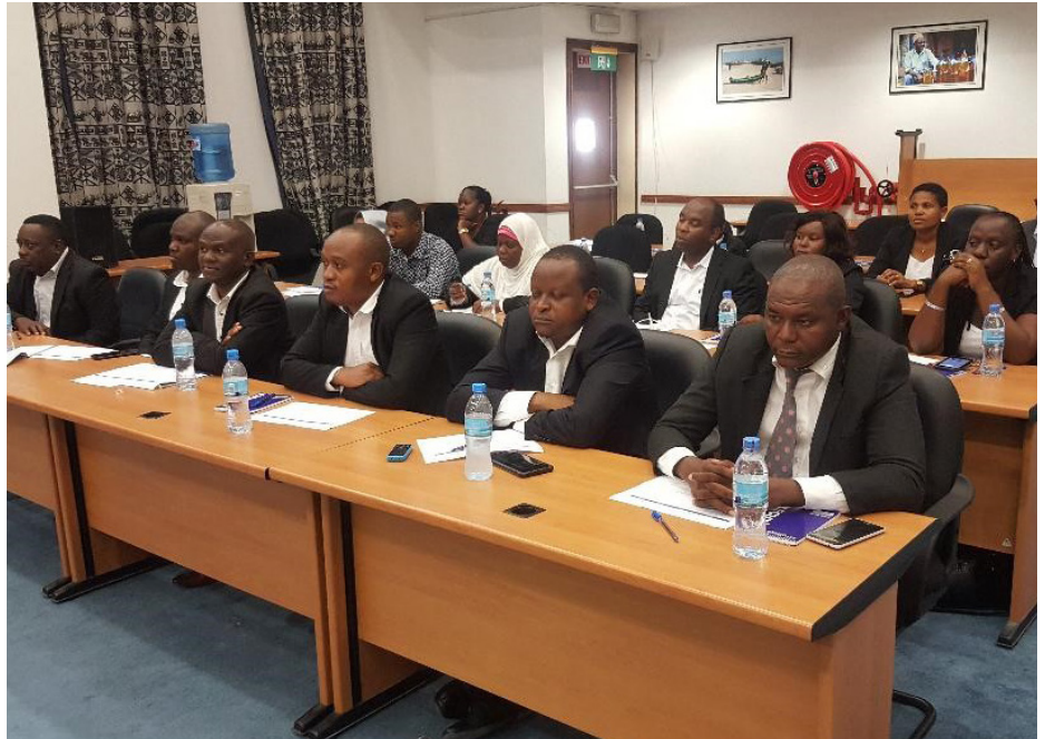
Maafisa wa Tume ya Upatanisho na Maelewano (CMA) na Kitengo cha Kushughulikia Migogoro (DHU) wakishiriki katika moja ya programu za kujenga uwezo katika upatanisho na migogoro ya kazi.

Kutokana na ujuzi wa kupatanisha kuimarika, viwango vya mafanikio katika utatuzi wa migogoro umeongezeka kote Tanzania Bara na Zanzibar. Kwa mujibu wa Bw. Shanes Nungu, Mkurugenzi wa CMA, kuimarika kwa uwezo wa CMA kumewezesha kutatua migogoro ya kazi na kuvuka malengo yaliyokuwa yamewekwa na taasisi hizo. Data zilizopo zinaonyesha kwamba katiak mwaka 2019/20, CMA ilifaulu kutatua migogoro 8,366. Lengo la mwaka huo lilikuwa kesi 3,500, jambo linaloonyesha kwamba utendaji ulikuwa wa juu sana. Mkurugenzi aliishukuru ILO na UN kwa msaada wao wa kuhakikisha kwamba migogoro ya kazi inamaamuriwa kwa wakati, na kwamba haki za wafanyakazi wanawake na wanaume zinalindwa kwa mujibu wa sheria za kazi na viwango vya