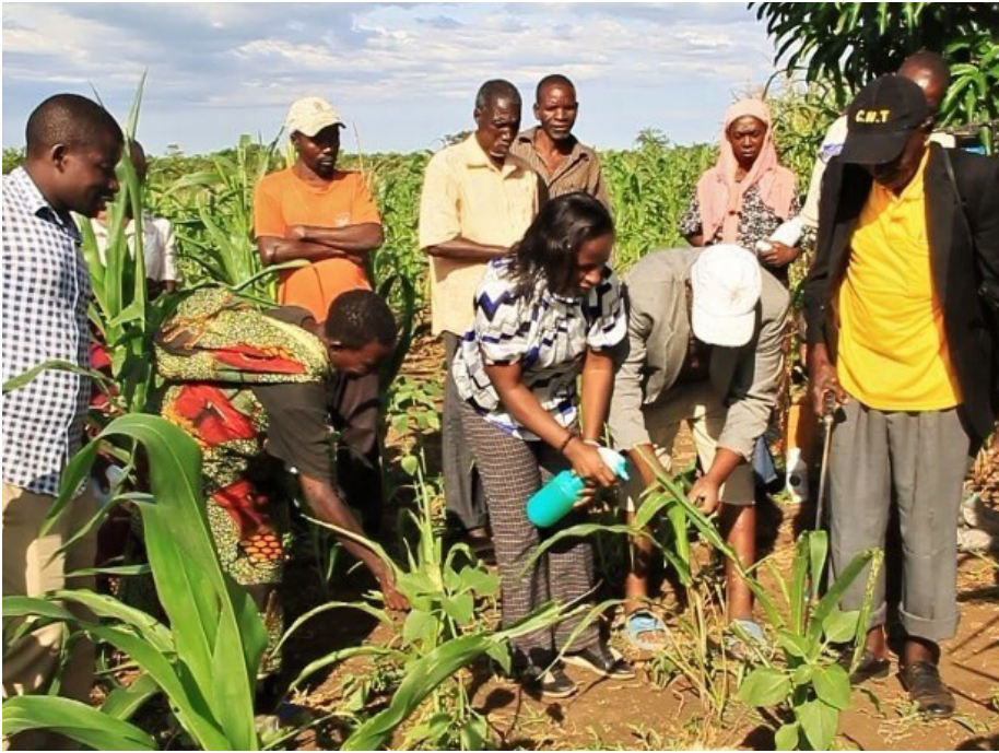
Watafiti na wakulima wakifanya majaribio ya Viuatilifu vya Kibiolojia vya Vuruga katika mashamba.

S hirika la Umoja wa Mataifa la Chakula na Kilimo (FAO) limetoa ufadhili kwa watafiti ili kutengeneza viuatilifu vya kibiolojia vitakavyosaidia kupambana na viwavi jeshi (FAW) wanaotishia usalama wa chakula na uhai nchini Tanzania.