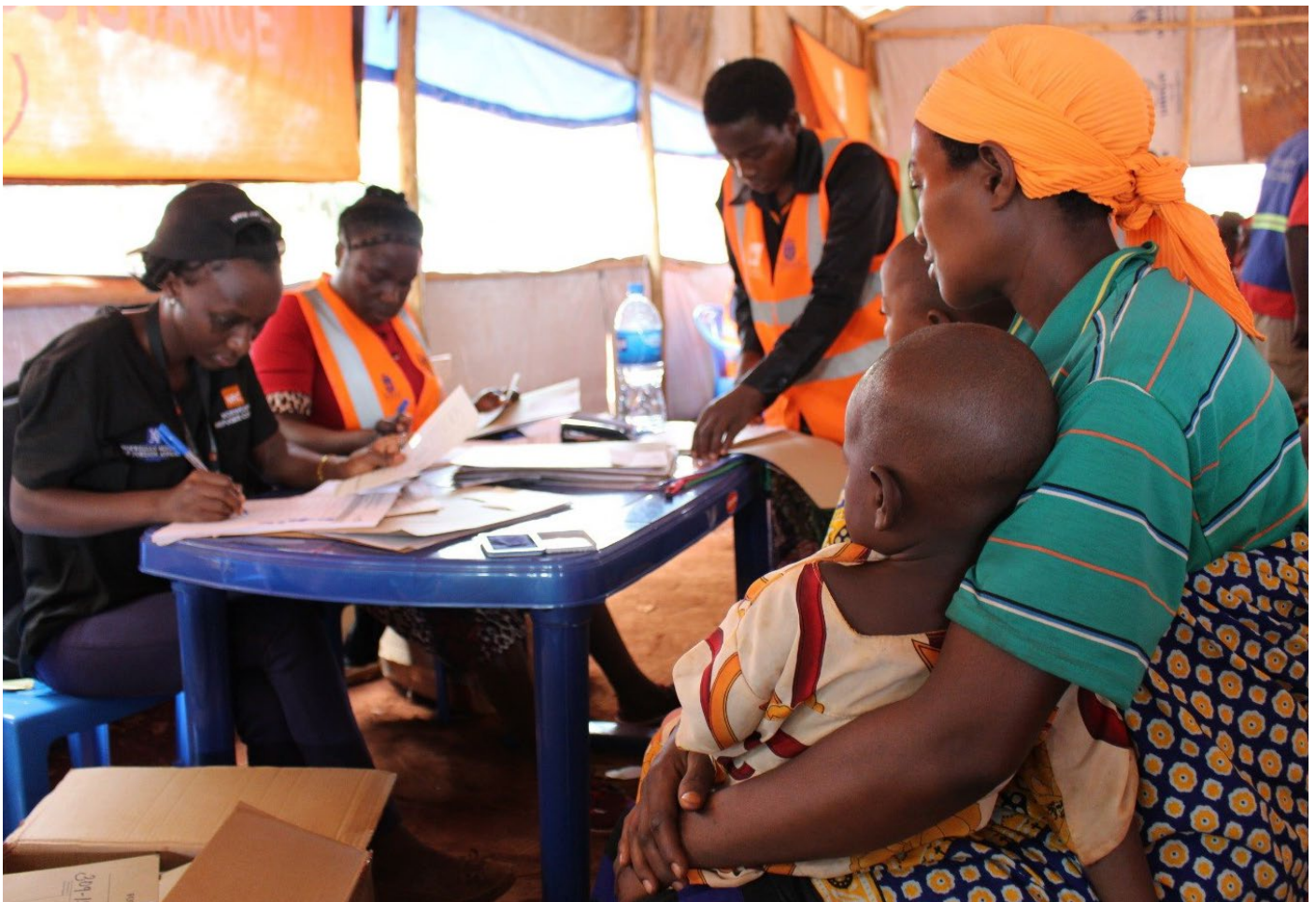
Zeomary akiwa katika mchakato wa kusajili vyeti vya kuzaliwa.

Zoezi la usajili, ambalo lilifanyika katika Kambi ya Nduta kama majaribio, litaenea pia katika kambi za Mtendeli na Nyarugusu. Kwa ujumla, watoto 55,000 hawana vyeti vya kuzaliwa na hivyo hawa watanufaika. "Mapacha wangu wenye bahati wamekuja na neema katika jamii. Yaani, nina hamu nifike nyumbani haraka nimwonyeshe mume wangu vyeti hivi," anasema kwa furaha.