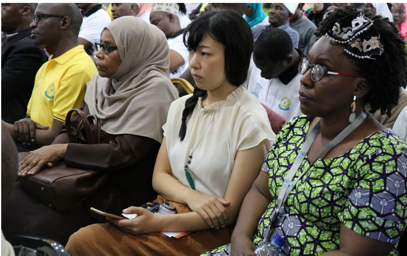
Washiriki katika maadhimisho ya Siku ya UKIMWI Duniani huko Zanzibar, wakiwemo wawakilishi wa Serikali na Mashirika ya Umoja wa Mataifa.