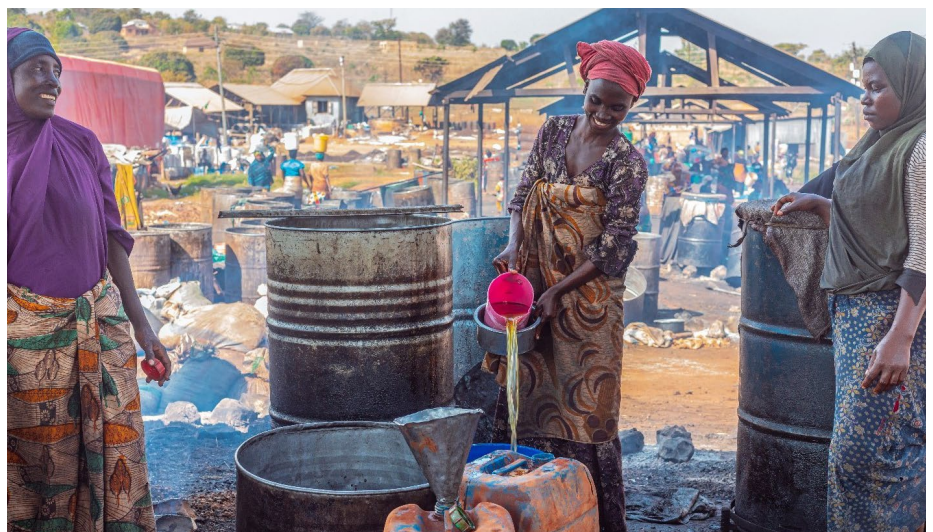
Baada ya msaada wa UNCDF, sasa wanawake wafanyabiashara wanatumia mashine za kisasa, ambazo zina kasi zaidi na zina ufanisi zaidi kulinganisha a mashine za kutumia jua.

Tabitha anaamaini kwamba hawatatumia tena muda mrefu kukausha bidhaa kwa kutumia mbinu ya zamani ya jua ambayo haikuwana ufanisi kwa kulinganisha na mashine za kisasa. “Uwezo wetu wa uzalishaji utaongezeka na tutaweza kununua mbegu zaidi ili kuzalisha mafuta zaidi.”