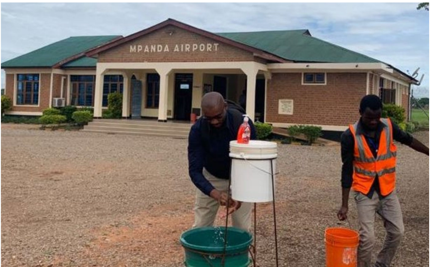
Itifaki ya ukaguzi wa udhibiti na kuzuia maambukizi katika vituo vya mipakani ni muhimu sana ili kuzuia mzunguko wa kuenea kwa magonjwa ya kuambukiza ukiwemo COVID-19.