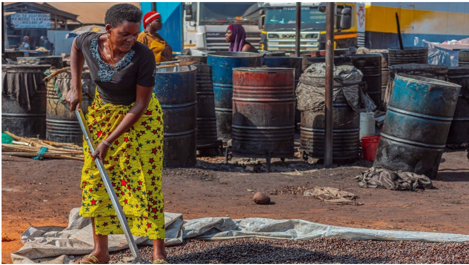
Mwanamke mfanyabiashara kutoka SIDO akianika mbegu za michikichi aki-tumia kikaushia cha jua tayari kwa uchakataji wa mafuta kabla ya msaada wa UNCDF.

K ihistoria, zao la migazi ni zao la miaka mingi katika Mkoa wa Kigoma. Zao hili hutoa mawese ambayo ni mafuta ya kupikia na kiini cha mbegu yake hutumika katika utengenezaji wa sabuni. Katika Manispaa ya Ujiji Kigoma ndiko kuliko na eneo la viwanda la SIDO, sehemu kubwa ya viini vya mawese vinavyozalishwa Kigoma Vijijini huchakatuliwa SIDO. Inakadiriwa kwamba kilo tatu za mbegu hutoa lita moja ya mafuta. Humchukua mwanamke mchapakazi kati ya siku 4 hadi 7 ili kukausha kilo 660 za mbegu za miwese ili kutoa lita 220 za mafuta, ambapo uzalishaji wa kila siku katika eneo la viwanda ni kuchakata tani 3 kwa siku kwa mashine moja.