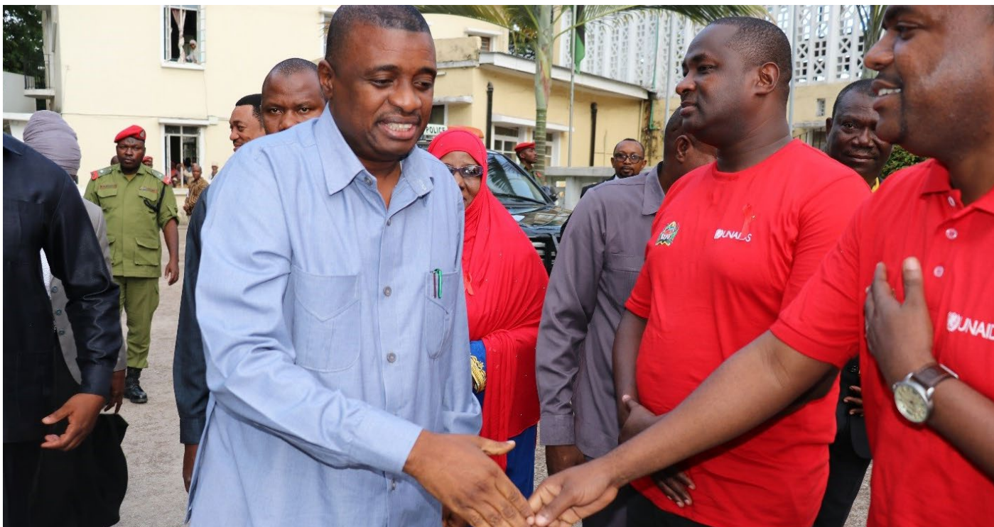
Mgeni Rasmi, Mh. Hemed Suleiman Abdulla, Makamo wa Pili wa Rais wa Zanzibar akiwasalimia baadhi ya waandaaji (UNAIDS na ZAC) wa maadhimisho ya siku ya UKIMWI Duniani (WAD) nje ya Ukumbi wa Idris Abdul Wakil.