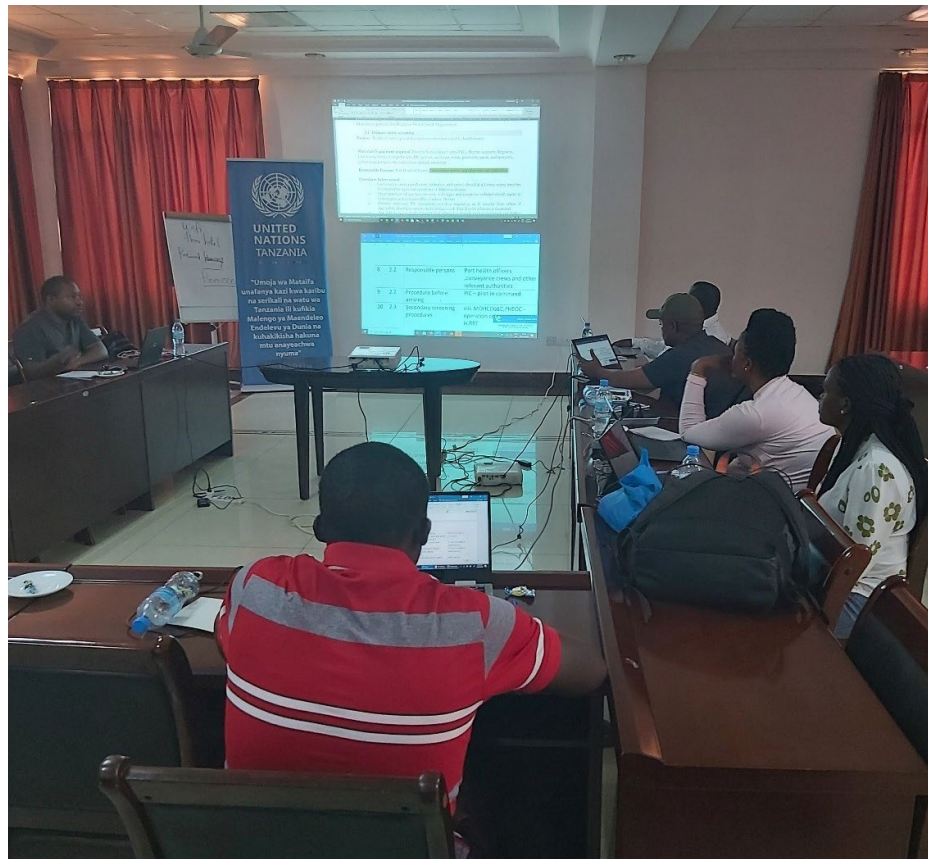
Timu ya wataalamu wa ufundi kutoka katika Wizara ya Afya wakipitia Miongozo ya Uendeshaji ya 4.

Zaidi ya hayo, IOM ilitoa miongozo ya kiufundi kuhusu ushirikiano katika mipango ya uvukaji mipakani kupitia uwezesaji wa mikutano ya uratibu inayohusisha nchi