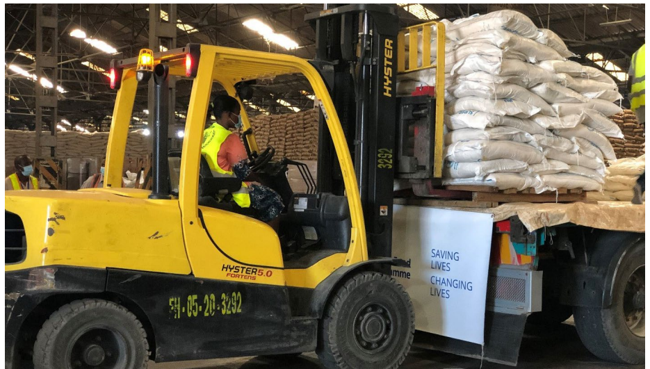
Ofisa wa bandari, akipakia chakula cha msaada katika Ghala la WFP katika Bandari ya Dar es Salaam. Chakula hicho kimenunuliwa kwa fedha zilizotolewa na Korea kwa ajili ya kazi ya kuhudumia wakimbizi.

Aliishukuru serikali ya Korea kwa utayari wake wa kutoa mwitikio na katika kuwekeza katika jamii zilizo hatarini zaidi, hasa wanawake na watoto. “Ninafurahi sana