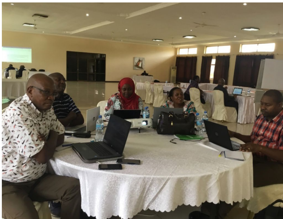
Timu ya wataalamu wa ufundi kutoka katika Wizara ya Afya wakipitia Miongozo ya Uendeshaji ya 3.

IOM Tanzania inashirikiana kwa karibu na mashirika ya Umoja wa Mataifa na imetambua Nguzo ya Uongozi katika Maeneo ya Mipaka (PoE) katika Mwitikio wa Umoja wa Mataifa kwa matukio ya masuala ya afya ya jamii nchini. Kwa namna ya kipekee, IOM Tanzania inaongoza katika hatua za kuimarisha ufuatiliaji katika Vituo vya Mipakani, Kuzuia na Kudhibiti Maambukizi (IPC) na Usafi wa Mazingira na Maji (WASH),