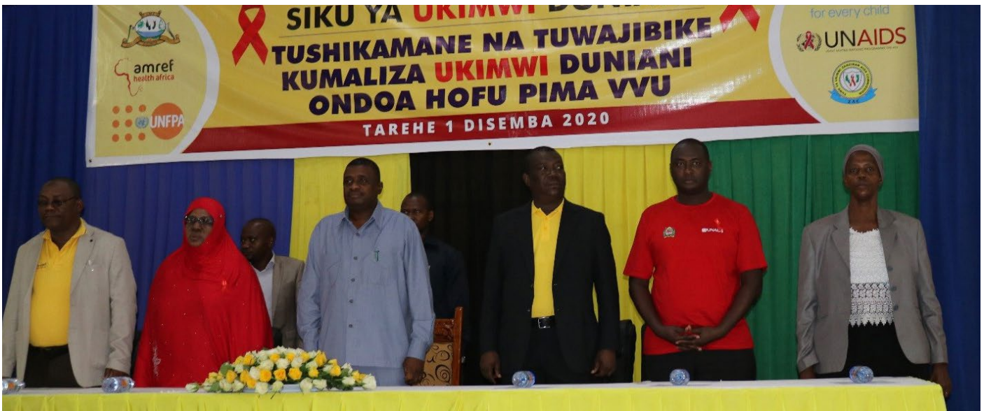
Mgeni Rasmi, Mh. Hemed Suleiman Abdulla, Makamo wa Pili wa Rais wa Zanzibar akiwasalimia baadhi ya waandaaji (UNAIDS na ZAC) wa maadhimisho ya siku ya UKIMWI Duniani (WAD) nje ya Ukumbi wa Idris Abdul Wakil.

D esemba Mosi kila mwaka, dunia hufanya kumbukumbu za Siku ya UKIMWI Duniani. Watu kote ulimwenguni huungana ili kuonyesha uungaji mkono wao watu wanaoishi na walioathirika na VVU na kuwakumbuka wale waliopoteza maisha yao kwa sababu ya UKIMWI. Kwa upande wa Zanzibar, kumbukumbu hizo zilifanyika katika Ukumbi wa Idris Abdul Wakil ambako viongozi wa serikali na washirika wa maendeleo walishirikiana ili kuadhimisha mafanikio yaliyokwishapatikana na kurejea upya ahadi zao za kukomesha UKIMWI huko Zanzibar. Kumbukumbu hizo zilizodumu kwa juma moja na siku ya kilele zilifanikishwa na UNAIDS, UNICEF, UNFPA na AMREF Africa, ambapo mgeni rasmi alikuwa Mh. Hemed