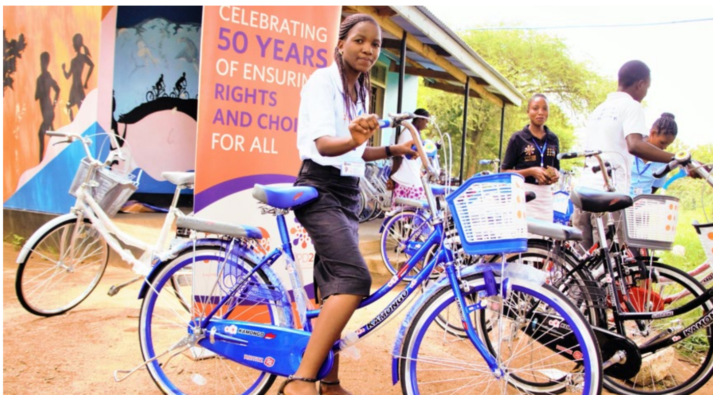
Baiskeli za UNFPA zitasaidia waelimisha rika katika Mkoa wa Simiyu kufanya kazi yao kwa urahisi zaidi.

Vikundi sita vya Waelimisha rika kutoka katika mpango unaosimamiwa na UNFPA wa Vikundi Rafiki kwa Waliobalehe na Vijana (Adolescent and Youth-Friendly (AYF) Corners) katika Mkoa wa Simiyu kila mmoja amekabidhiwa baiskeli ili kurahisisha kazi yao ngumu wanayofanya katika jamii.