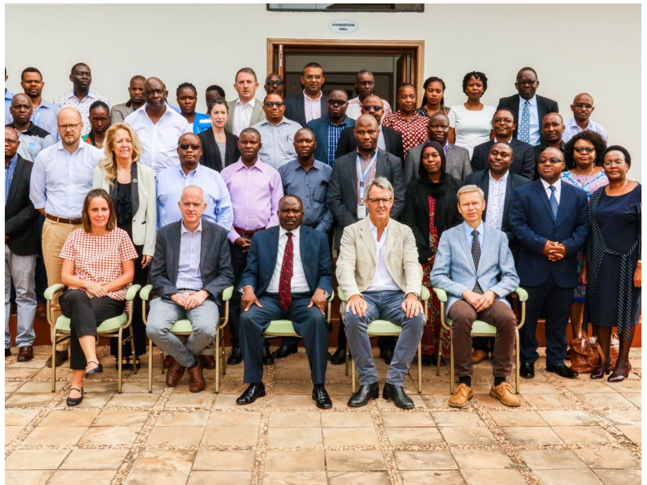
Picha ya pamoja ya ujumbe (Maofisa kutoka Balozi za Ireland, Ufalme wa Norway na Sweden, Serikali, na Umoja wa Mataifa) wakati wa Mkutano wa Kamati ya Uongozi ya Programu ya Pamoja ya Kigoma uliofanyika Mkoa wa Kigoma, mwezi Februari.

Norway ni mwungaji mkono madhubuti wa Mfuko wa Pamoja wa Umoja wa Mataifa (UN One Fund) na msaada wake kwa KJP unamaanisha kwamba zaidi ya wakulima wadogowadogo 9,000 wamejenga taratibu bora za uvunaji na uhifadhi mazao; Kamati za Ulinzi wa Wanawake na Watoto zimeanzishwa katika halmashauri nne ambako KJP inatekelezwa; na wajasiriamali vijana na wanawake 12,894 wamenufaika na mafunzo ya kuongeza ujuzi, usimamizi wa biashara na kuwezesha upatikanaji wa fedha. Ujenzi na ukarabati wa mifumo 11 ya usambazaji maji na pia maeneo ya usafi binafsi na wa mazingira