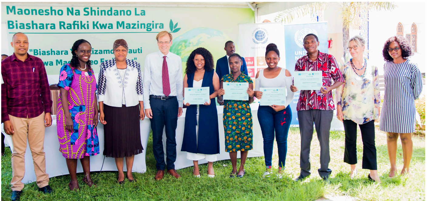
Washindi nane wa katika Shindano la Green Challenge walichaguliwa kutoka katika makundi manne tofauti – Kampuni za Kijani (uzalishaji viwandani au huduma), Makampuni ya Kijani ya Kilimo, Nishati Mbadala na Usimamizi wa Taka na Kurejelesha.