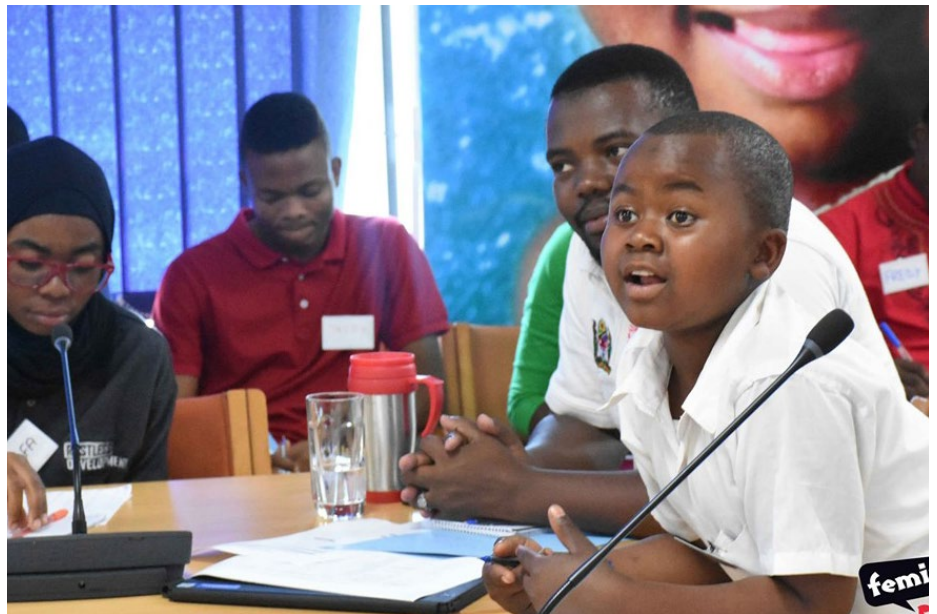
Watoto wakijadili katika moja ya mikutano ya mashauriano huko Mbeya.

Mchakato wa uandaaji Ajenda hiyo, mikutano iliyofuatia ya ushawishi kwa wenye kutoa maamuzi, na Mkutano Mkuu wa Vijana yote inawezesha kuleta ushiriki wenye maana wa vijana katika mchakato wa kutoa maamuzi, ambalo ndiyo kiini cha kazi ya Generation Unlimited nchini Tanzania. Hivi sasa watoto na vijana sasa wanataka muundo-dhana mpya ambao utawachukulia watoto kama wadau zaidi kuliko wanufaika, ya sheria na dola, lakini kama wadau, ambao wanajua nini wanataka kwa maana ya sera, vipaumbele na majuk-