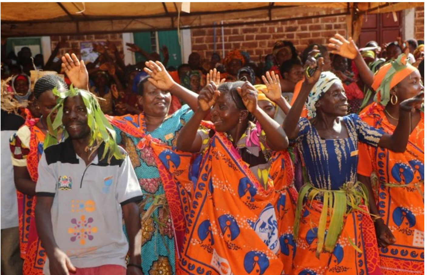
Wanawake wajawazito sasa wanaweza kupata huduma za matunzo kwa haraka na kutoka kwa watumishi wenye ujuzi. Huduma hizi ni pamoja na matunzo wakati wa ujauzito, kujifungua, na katika majuma yanayofuatia baada ya uzazi. Yote haya yanafanyika katika wadi ya wazazi ya Zahanati ya Muzye baada ya ukarabati.

UNFPA inaendelea kuunga mkono juhudi za kuongeza kasi katika kuzuia kabisa vifo vya akina mama wakati wa kujifungua hapo ifikapo mwaka 2030, kuhakikisha kuwa hakuna mtu yeyote anayeachwa nyuma katika utekezaji wa malengo ya maendeleo ya dunia nchini Tanzania.